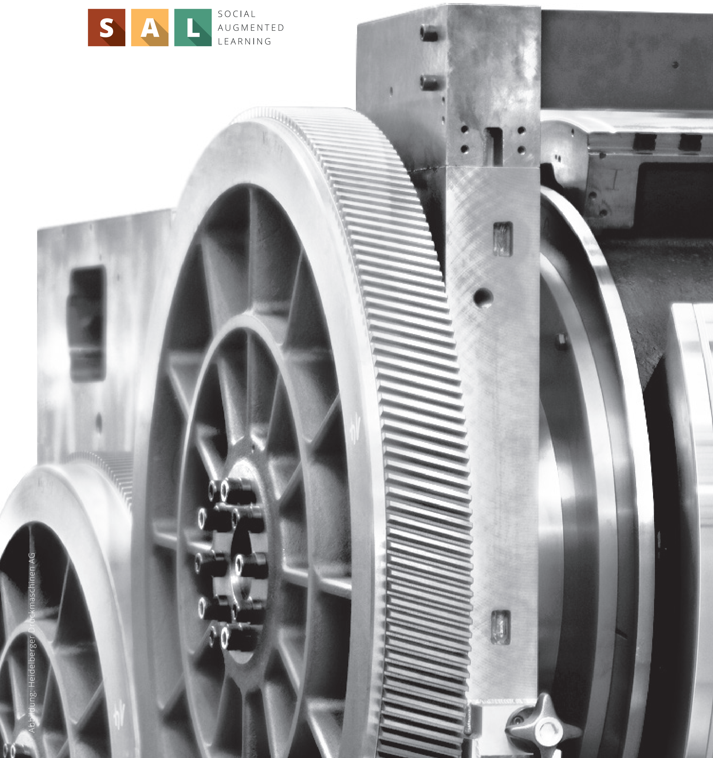
Abbildung: Heidelberger Druckmaschinen AG